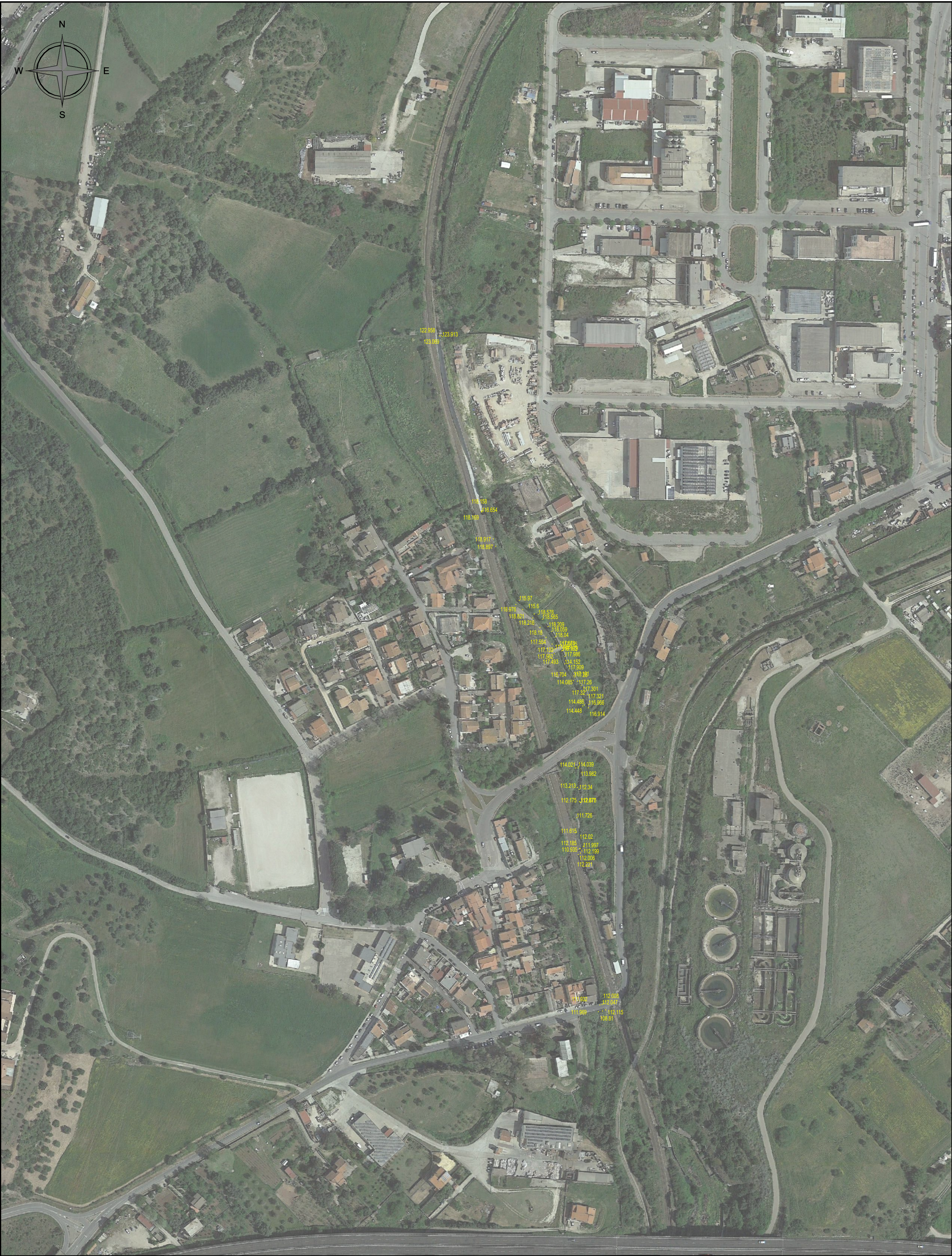
CARTOGRAFIA DI BASE: Rilievo aerofotogrammetrico comunale - Foglio n.57 - scala 1:2.000